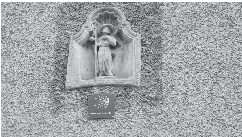
Abb. 1.1: Wegmarke des Pilgerwegs nach Santiago de Compostela

Wir gehen am Drontömpa vorbei, der Freiburger Zweigstelle für den Kadampa-Buddhismus, später entdecken wir ein weiteres Yogastudio. Auf dem Weg Richtung Bahnhof passieren wir die Einkaufsgasse, spähen in Schaufenster und entdecken afrikanische Weihnachtskrippen im Weltladen, die Statue des tanzenden Shivas in einem Kleiderladen, Karma-Armbänder in einem Juwe-