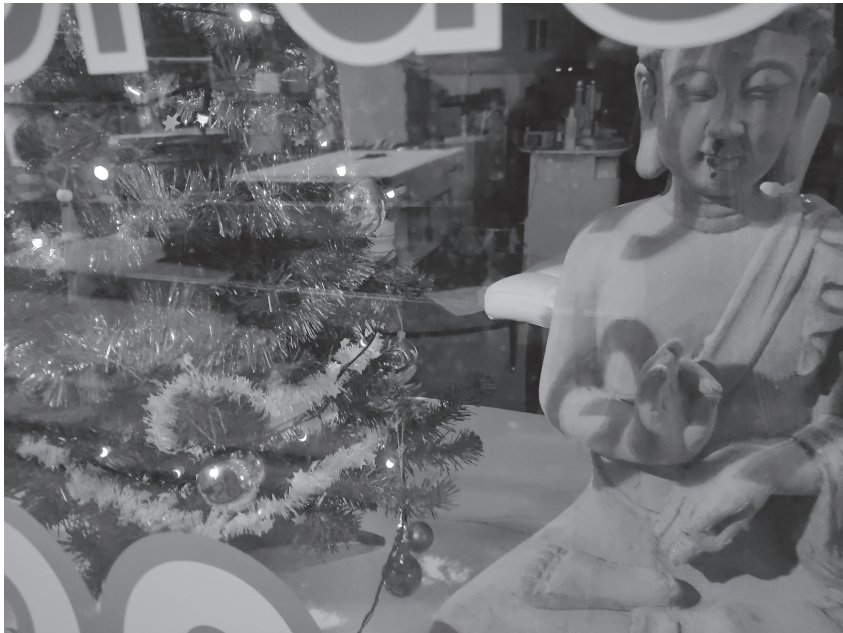
Abb. 1.2: Buddhastatue nebst Weihnachtsdeko in einem Nagelstudio