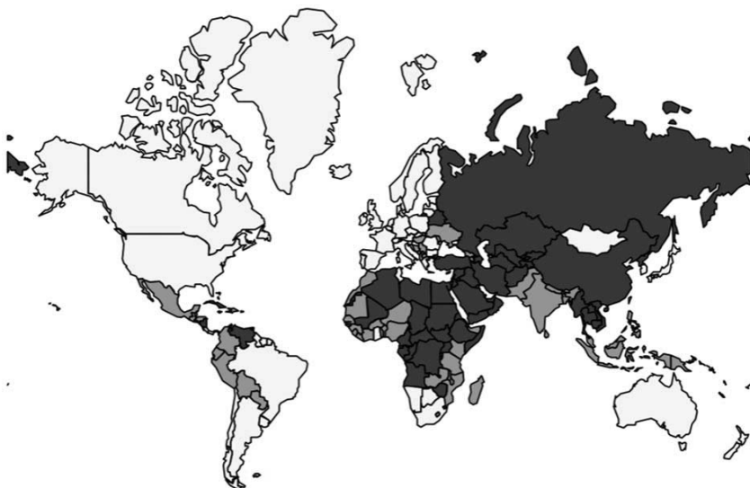
Abbildung I.1: Freie, unfreie, teilweise freie Staaten, 2025

Erläuterung: weiß: freie, dunkelgrau: unfreie, hellgrau: teilweise freie Staaten.