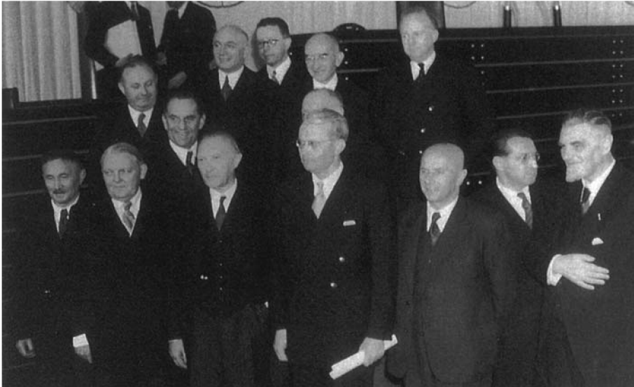
Abbildung 1.4: Das 1. Kabinett Adenauer im Deutschen Bundestag.

nisterien einzurichten, z. B. für Vertriebene und für Angelegenheiten des Marshallplans. So bildeten dann der Bundeskanzler und 13 Minister das Kabinett der ersten Bundesregierung.